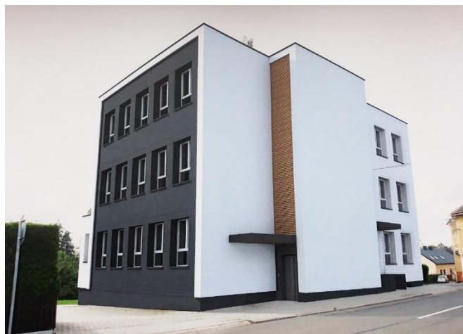
Vizualizace z projektové dokumentace

V rámci projektu „Modernizace bývalého obecního úřadu v Koberčicích“ bylo podepsáno Memorandum o dlouhodobé spolupráci mezi organizací DomA – domácí asistence a obcí Koberčice. Tímto Memorandem vyslovují obě strany odhodlání a společnou vůli spolupracovat při přípravě a realizaci projektu tak, aby bylo dosaženo jeho cíle a účelu.